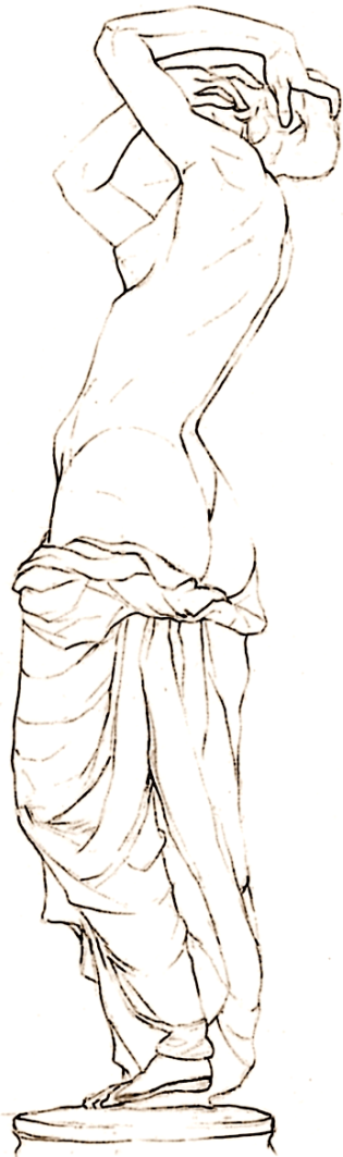
Dessin d'élève